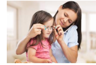
Vivienda y Refugio