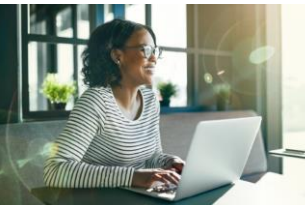
Ayuda Económica y Programas