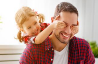
Asuntos Legales e Inmigración