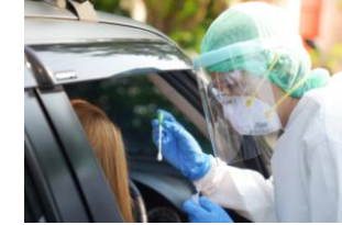
Información sobre la COVID-19 y Otros Recursos Comunitarios