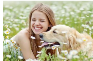
Salud Conductual y Salud Mental